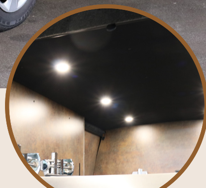
INTERIEUR - HEMEL

Alles in eigen huis, alles onder één dak