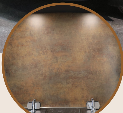
INTERIEUR - WAND