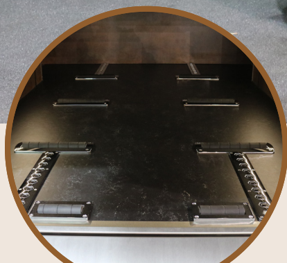
INTERIEUR - VLOER