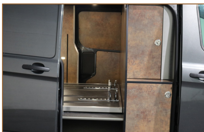
OPBERGKAST ACHTER 1E ZITRIJ