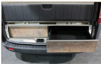
GROTE LADE ACHTERZIJDE