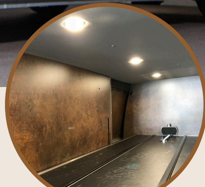
INTERIEUR - HEMEL

Alles in eigen huis, alles onder één dak