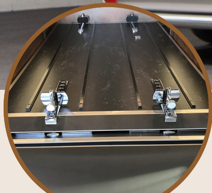
INTERIEUR - VLOER