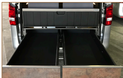
GROTE LADES ACHTERZIJDE