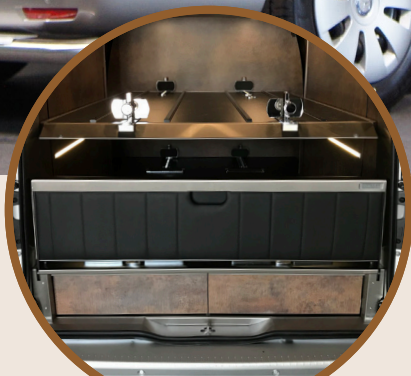
INTERIEUR - WAND