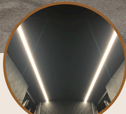
INTERIEUR - HEMEL

Alles in eigen huis, alles onder één dak