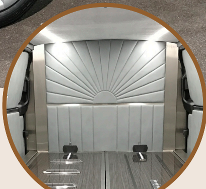
INTERIEUR - WAND