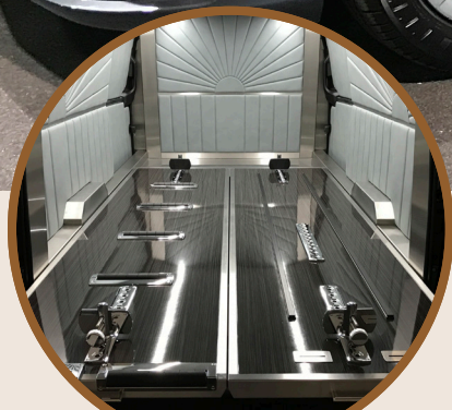
INTERIEUR - VLOER