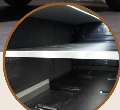
INTERIEUR - HEMEL

Alles in eigen huis, alles onder één dak