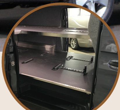
INTERIEUR - WAND