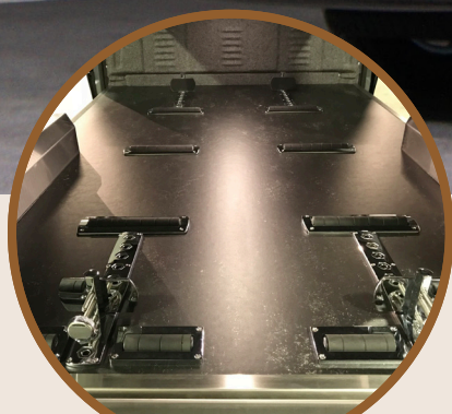
INTERIEUR - VLOER